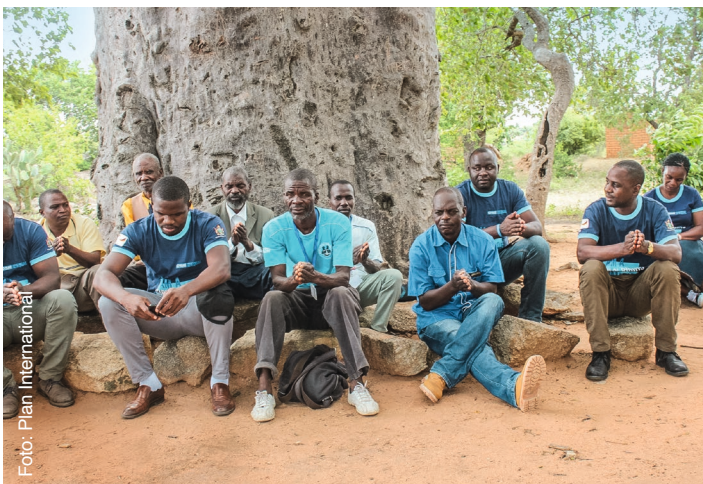
Väter und andere männliche Betreuungspersonen befassen sich in den Elternzirkeln mit bestehenden Geschlechterrollen und Gleichberechtigung.

Um traditionelle schädliche Praktiken wie Kinderheirat langfristig abzuschaffen, müssen zunächst gesellschaftliche Normen und Traditionen aufgebrochen sowie funktionierende Kinderschutzstrukturen etabliert werden. Dazu ist es wichtig, die Gemeinden für die negativen Aspekte von