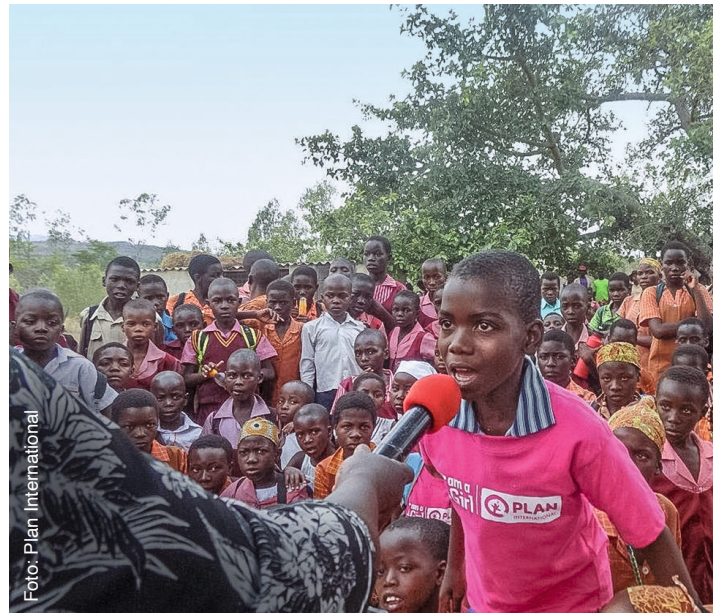
In Sensibilisierungskampagnen klären wir die Gemeinden über die Gefahren von Kinderheirat auf.

Frühverheiratung und die Rechte von Kindern, insbesondere von Mädchen, zu sensibilisieren. In diesem Zusammenhang führen wir insgesamt sechs Sensibilisierungskampagnen in den beiden Projektdistrikten durch. Dazu nutzen wir beispielsweise auch die jährlichen Veranstaltungen zum Internationalen Tag des Mädchens und der Menstruationshygiene sowie zum Tag des afrikanischen Kindes. Themen sind vor allem die Beendigung von Kinderheirat aber auch die Bedeutung von Bildung, Kinderschutz sowie Informationen zu Dienstleistungen im Bereich der sexuellen und reproduktiven Gesundheit.