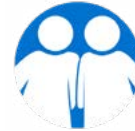
Sexuelle und reproduktive Gesundheit und Rechte