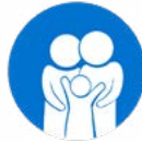
Wirtschaftliche Stärkung von Jugendlichen