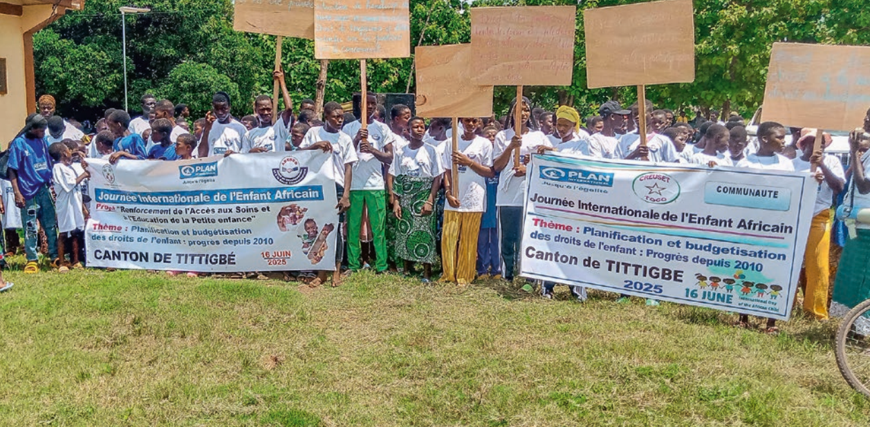
Am Tag des afrikanischen Kindes haben wir Menschen über Kinderrechte und gesunde Entwicklung von Kindern informiert