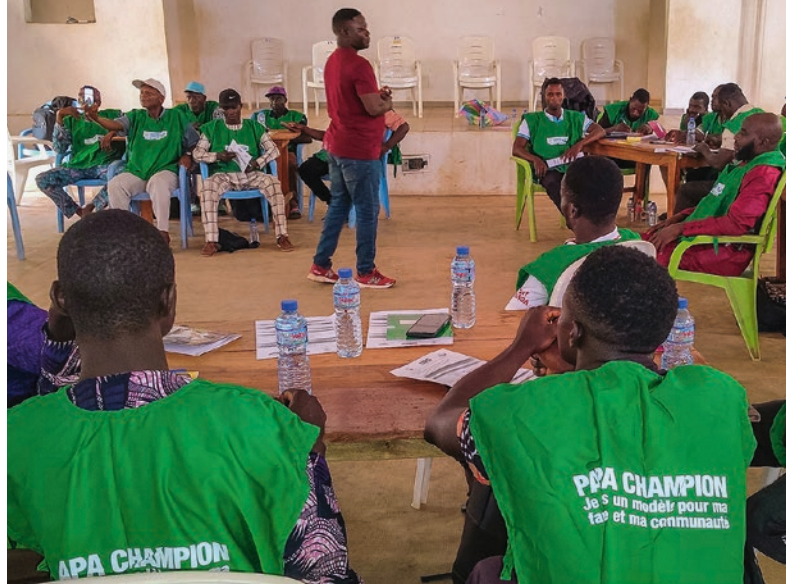
Dad Champions: wir schulen Väter, wie sie sich in ihren Familien engagieren können – mit positiven Erziehungsmethoden und mehr Wissen zu frühkindlicher Entwicklung

Um wichtige Gesundheitsleistungen für mehr Menschen zugänglich zu machen, haben wir eine mobile Klinik ausgestattet und besuchen mit dieser regelmäßig Projektgemeinden. Unter anderem ermöglicht diese Aktivität, dass Schwangere einen einfacheren Zugang zu Schwangerschaftsvorsorge und Moskitonetzen haben, Kinder regelmäßig geimpft werden und Eltern fundierte Informationen zur richtigen Ernährung ihrer Kleinkinder erhalten und bei der Familienplanung unterstützt werden.